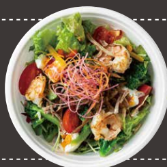
モノクロームサラダ