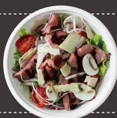
極黒牛のローストビーフサラダ