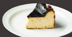
バスクチーズケーキ