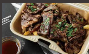
ブラックアングス牛のステーキ