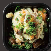
秋刀魚の燻製ポテトサラダ