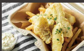
フィッシュ&チップス