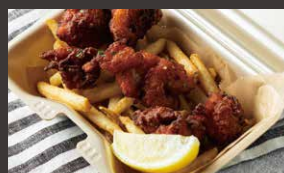
スパイシーチキン&チップス