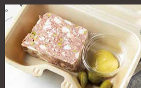
パテ・ド・カンパーニュ