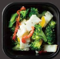
ヤリイカとブロッコリーのアンチョビマリネ